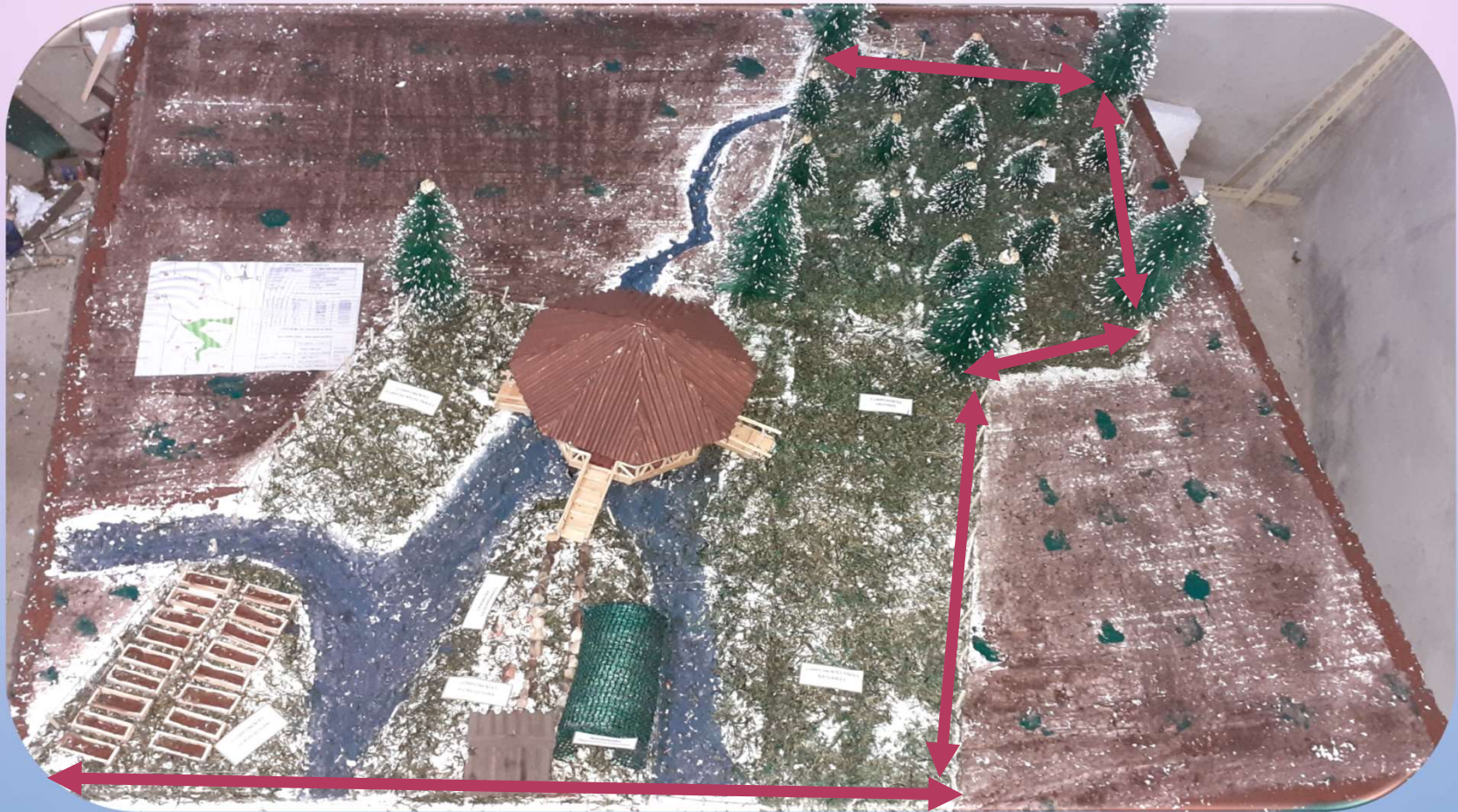
COBERTURA DEL AVANCE 60%